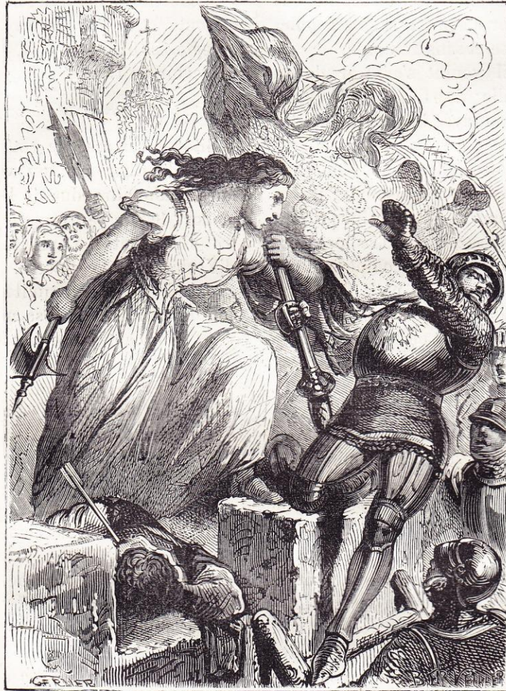
Jeanne Hachette au siège de Beauvais (juin 1472).

plus vain de son mérite et de sa finesse que de sa couronne et de sa naissance, conseillé du reste par le cardinal La Balue qui le trahissait, il fit accepter au duc une entrevue à Péronne et se rendit presque sans escorte au milieu